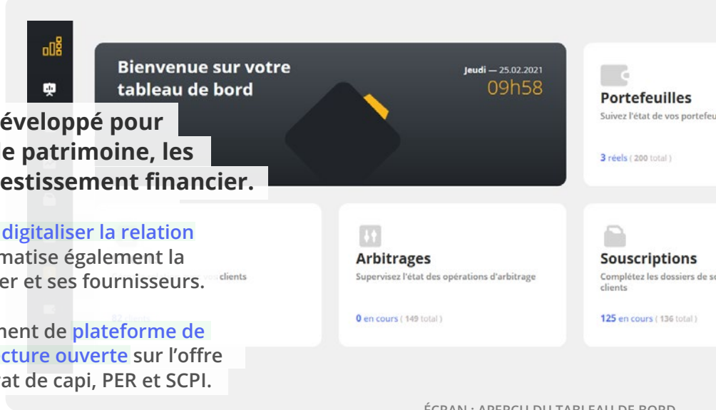
ÉCRAN : APERÇU DU TABLEAU DE BORD

SmartInvest revendique un positionnement de plateforme de service et de place de marché en architecture ouverte sur l'offre des fournisseurs en assurance vie, contrat de capi, PER et SCPI.